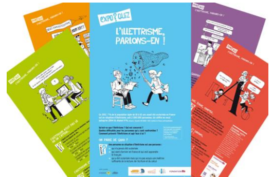
L'exposition a été réalisée par le Moutard et conçue en partenariat avec la Fondation SNCF.