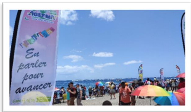
Le CRI au cœur du Tour des Yoles 2023

Le CRI (Centre Ressources Illettrisme) est à votre écoute toute l'année au numéro vert ci-dessous